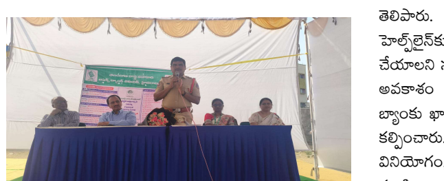
సోషల్ మీడియా మోసాల ద్వారా అమాయకులను లక్ష్యంగా చేసుకుని డబ్బులు దోచుకుంటున్నారని హెచ్చరించారు. ఎవరితోనూ ఓటీపీ, ఏటీఎం పిన్, సీవీవీ నంబర్లు వంటి వ్యక్తిగత బ్యాంకింగ్ వివరాలు పంచుకోకూడదని సూచించారు. అనుమానాస్పద మెసేజీలు, లింకులు, రివార్డు ఆఫర్లు, లోన్ ఆఫర్లు వంటి వాటిని నమ్మవద్దని, ఎటువంటి లావాదేవీ చేయడానికి ముందు ధృవీకరించుకోవాలని