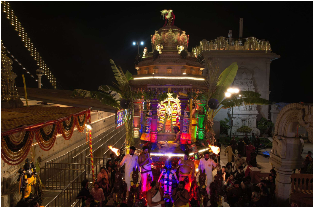
గోపికా నృత్యాలు, భక్తిపాటలకు అనుగుణంగా వేసిన వేషధారణలు మరియు మంగళ వాయిద్యాల హోరుతో అడుగులు ఆధ్యాత్మిక ఉత్సాహాన్ని నింపాయి. వివిధ ప్రాంతాల రథయాత్ర మార్గమంతా కళకళలాడింది. నుండి వచ్చిన జానపద కళాకారుల ప్రదర్శనలు,

ప్రతిఘటన, యాదాద్రి భువనగిరి జిల్లా రిపోర్టర్ జంగిటి రవీందర్ : స్వర్గిని పుణ్యక్షేత్రం భక్తి పారవశ్యంలో మునిగిపోయింది. శ్రీ వెంకటేశ్వర స్వామి వారి వార్షిక బ్రహ్మోత్సవాలలో భాగంగా తొమ్మిదో రోజు నిర్వహించిన మహా రథోత్సవం నేతరవంగా సాగింది. వేలాదిగా తరలివచ్చిన భక్తుల సందోహం మధ్య స్వామి వారు రథారూఢుడై భక్తులకు దర్శనమిచ్చారు. ఉదయం నుండి ఆలయంలో విశేష పూజలు నిర్వహించిన అనంతరం, వేద మంత్రోచ్ఛారణల మధ్య శ్రీదేవి, భూదేవి సమేత శ్రీ వెంకటేశ్వర స్వామి వారిని సర్వాంగ సుందరంగా అలంకరించిన భారీ రథంపై అధిష్టించబడింది. మంగళవాద్యాలు, భక్తుల కోలాటాల నడుమ రథం ఆలయ వీధుల్లో వైభవంగా సాగింది. భక్తులు రథం తాళ్లను పట్టుకుని లాగుతూ, "గోవిందా.. గోవిందా.." అంటూ చేసిన నామస్మరణతో స్వర్గిని ప్రాంతం ఆధ్యాత్మిక చైతన్యంతో నిండిపోయింది. బ్రహ్మోత్సవాల్లోనే అత్యంత కీలకమైన ఈ ఘట్టాన్ని వీక్షించేందుకు పరిసర ప్రాంతాల నుండి కాకుండా సుదూర ప్రాంతాల నుండి భక్తులు భారీగా తరలివచ్చారు. రథోత్సవం పొడవునా వివిధ జానపద కళారూపాలు, భజన మండల ప్రదర్శనలు ప్రత్యేక ఆకర్షణగా నిలిచాయి. రథోత్సవం పొడవునా సాగిన సాంస్కృతిక ప్రదర్శనలు భక్తులను మంత్రముగ్ధులను చేశాయి. రథం ముందు సాగిన కోలాటాలు ప్రత్యేక ఆకర్షణగా నిలిచాయి. చిన్నారలు, మహిళలు చేసిన